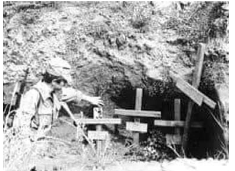
Kryžiais pažymimos karių žūties vietos.

„Gvardiečiai buvo nepaprastai žiaurūs: kai po vieno kaimo bombardavimo iš rūsio išlindo jame besislėpusi šeima ir pamatė svetimą turtą grobiančius okupantus, šie nužudė devynis liudininkus, o išsigelbėjo tik vienas, likęs slėptis rūsyje sto-